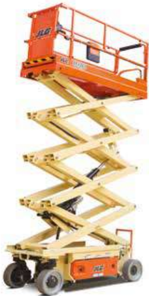
Ciseau 10 m Electrique