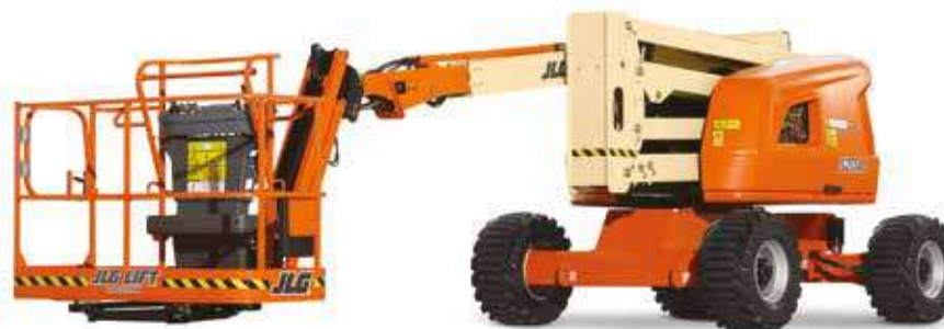
Nacelle Articulée Diesel